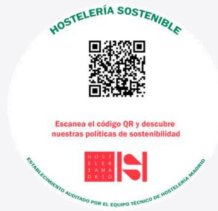
DISTINTIVO - HOSTELERÍA SOSTENIBLE