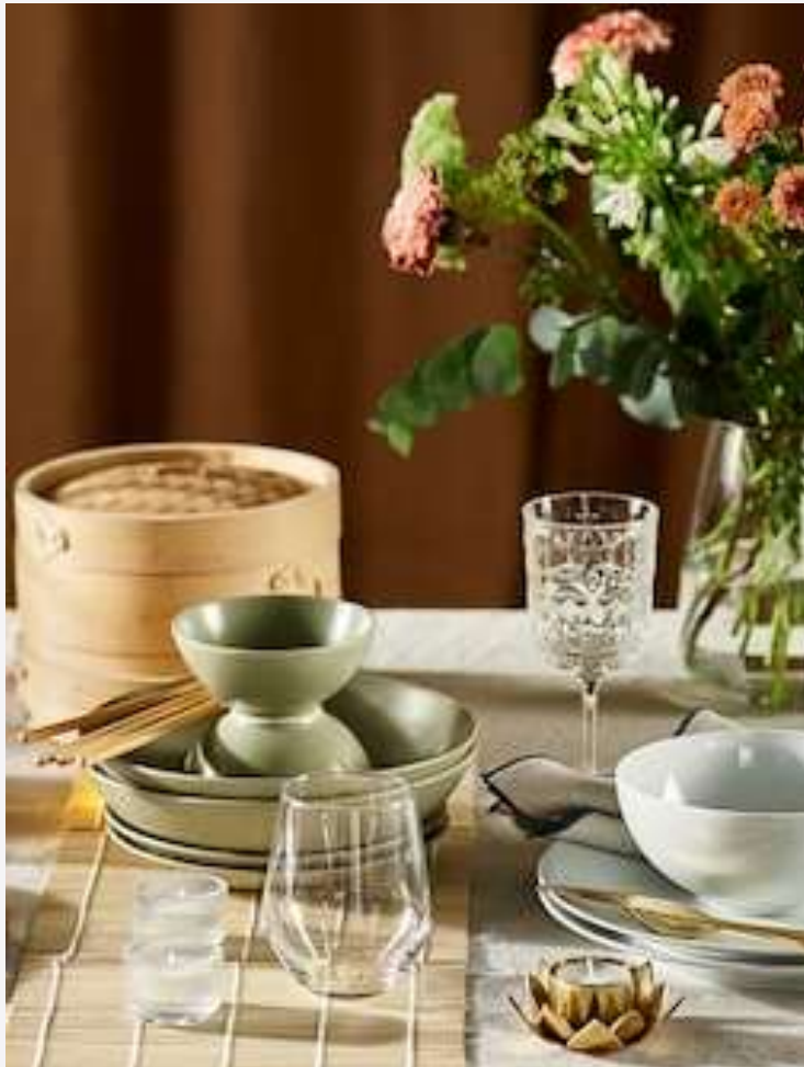
MENAJE PARA HOSTELERÍA