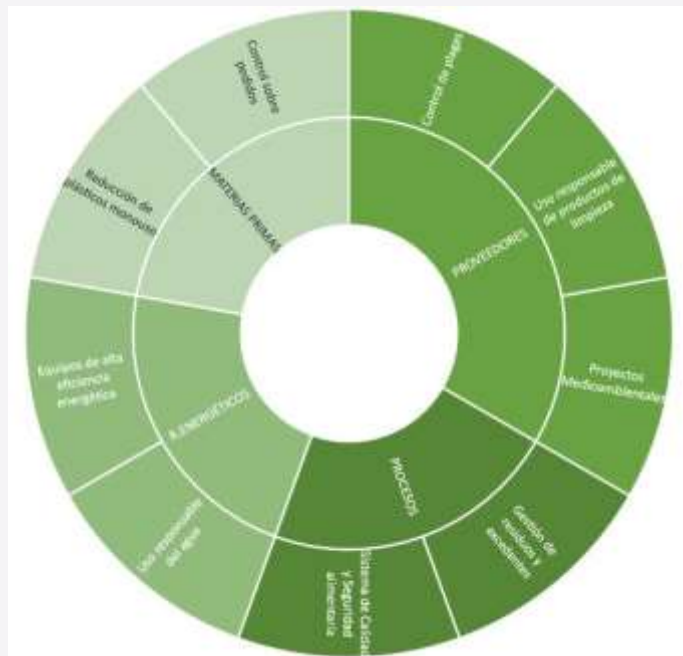
POLÍTICAS DE SOSTENIBILIDAD